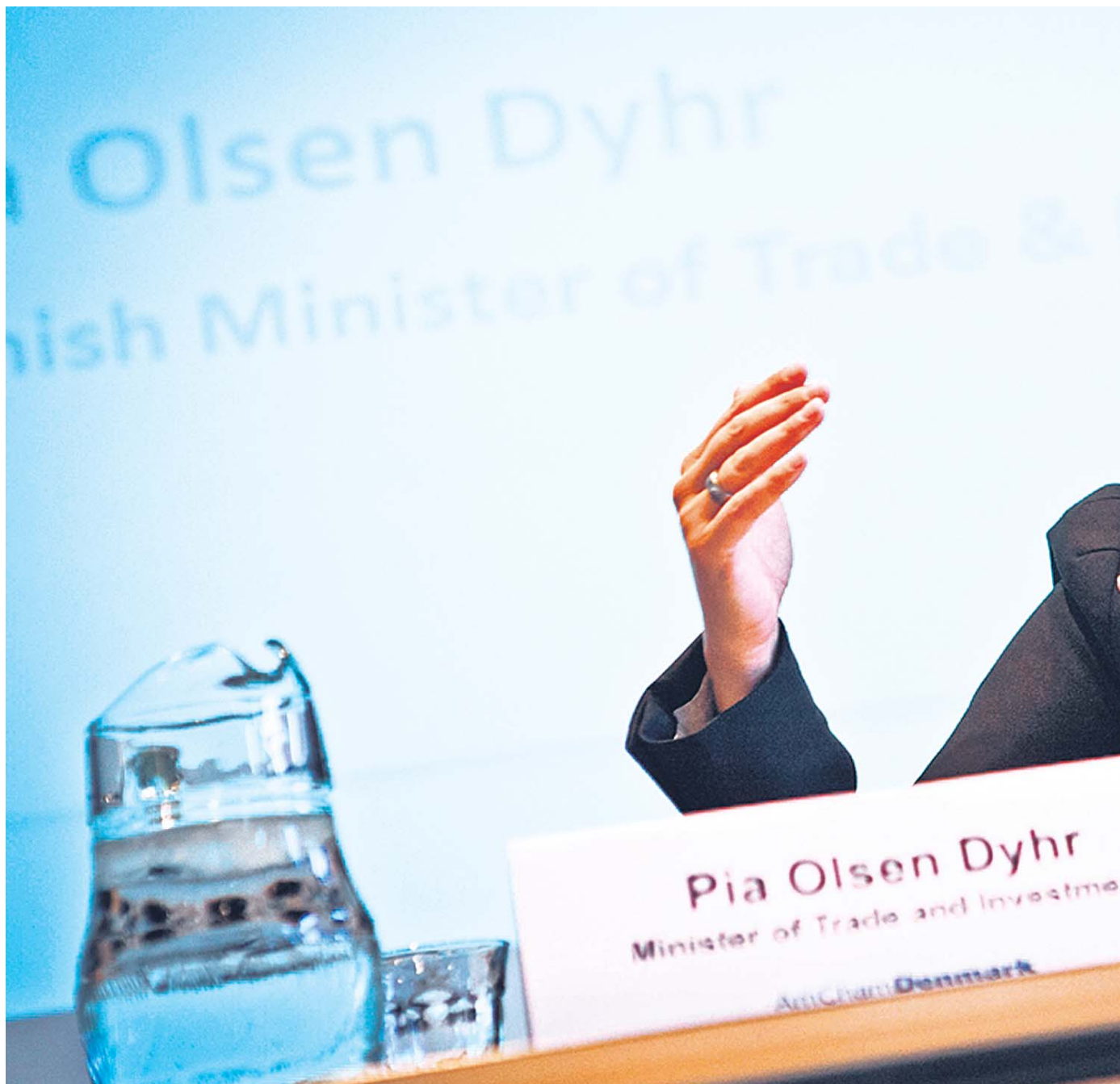
Taani kaubanduse ja investeeringute minister Pia Olsen Dyhr rõhutab rohelise energia ja energiasäästu olulisust ig

Oleme euroga nii seotud, et keegi ei saa väita, et sellel, mis toimub euroga, pole mingit mõju Taani kroonile. See mõju on olemas. Kuna eurol