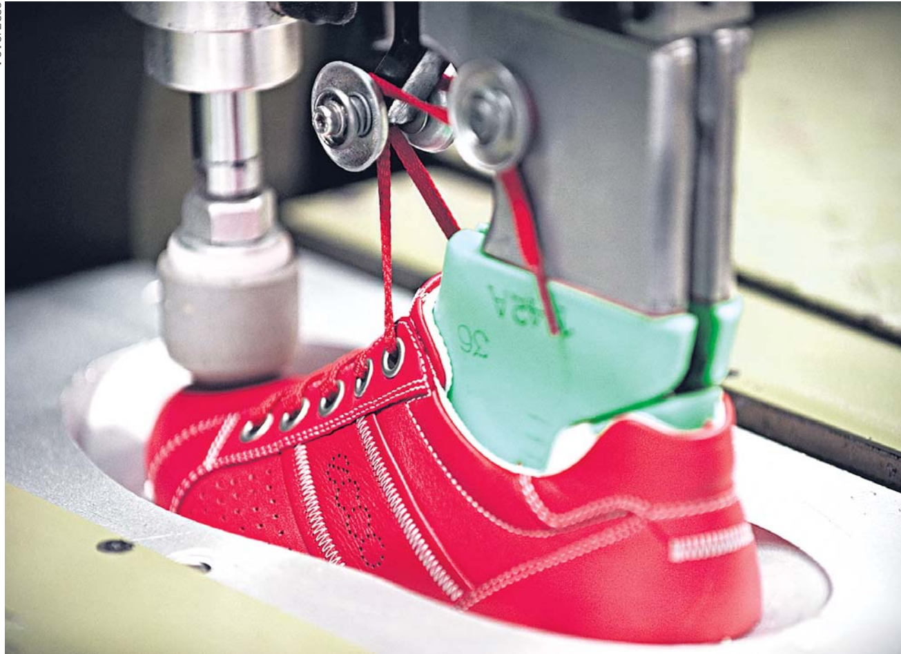
Hinnatud Ecco jalatsid on tuntud ka Eestis.

Ühe teise firma edu algas Billundis 1932. aastal puust mänguasjade valmistamisega. Kui mõne aja pärast lisandusid plastist lelude ja ehitusklotsid, oli fenomen sündinud. Esimene partii praegu eksimatult tuttavaid ja iseloomulikke klotse valmis 1958. aastal neljas värvis ning nelja ja kaheksa «nupuga». Kohe kõigi laste lemmikuks saanud Lego (lühend taanikeelsest «leg godt» – mängi hästi) klotse ja mänguasju müüakse nüüd rohkem kui 130 riigis ning Ole Kirk Kristianseni väikesest perefir-