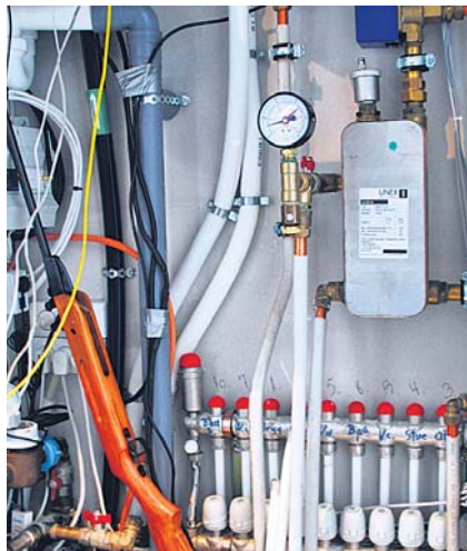
Maja aju - abihoones asuv juhtimiskeskus.

kokku hoidma,» kinnitavad majaomanikud. «Aga me pole kunagi ka laristanud, ei siin ega eelmises majas.»