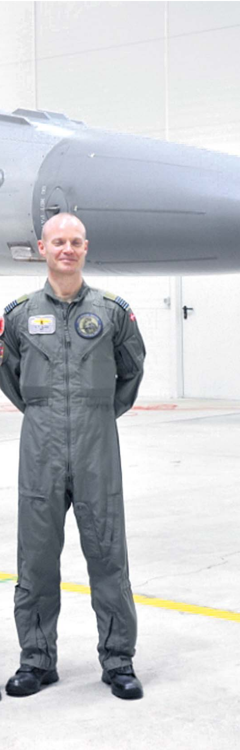
um kindlalt kontrolli all.