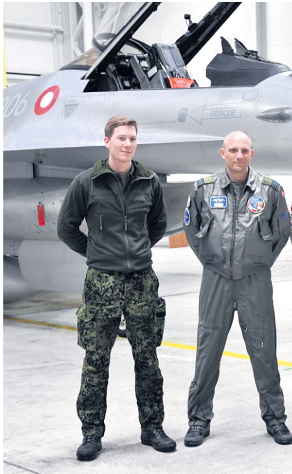
Kuningliku õhuväe piloodid, kelle valvsa silma all hoitakse Balti riikide õhuruumi

20 aastat tagasi oli Lundbeck üks esimesi ravimifirmasid, kes lõi Eestisse oma tütarettevõtte.